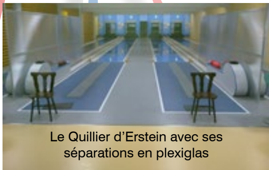
Le Quillier d'Erstein avec ses séparations en plexiglas

La situation sanitaire due au COVID bouleverse nos habitudes de jouer. En effet, la plupart des quilliers se trouve dans des complexes sportifs et appartient aux Communes qui n'ont pas toujours donné l'autorisation d'ouverture. Ainsi certains quilliers se trouvant notamment dans le Bas-Rhin n'ont pu ouvrir que depuis quinze jours, privant ainsi d'entraînement les joueurs des clubs concernés. D'autres municipalités n'autorisent de jouer qu'une piste sur deux, ce qui n'arrange pas la durée des matchs.