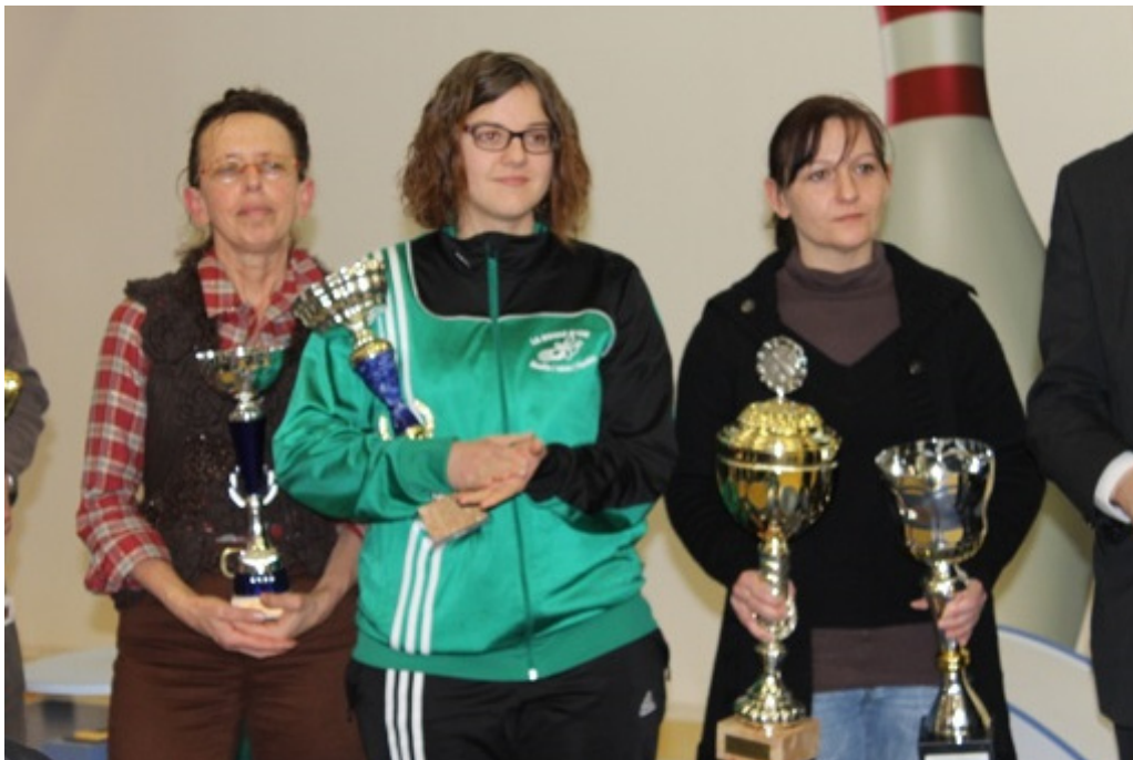
Les capitaines des trois équipes lors de la distribution des prix

Jacques MERLE Responsable de la Communication.